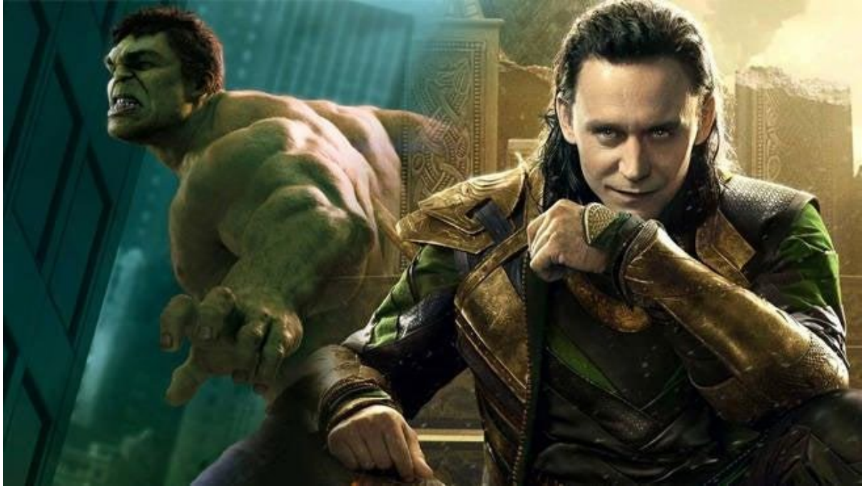
Pontoon La Ak Loki