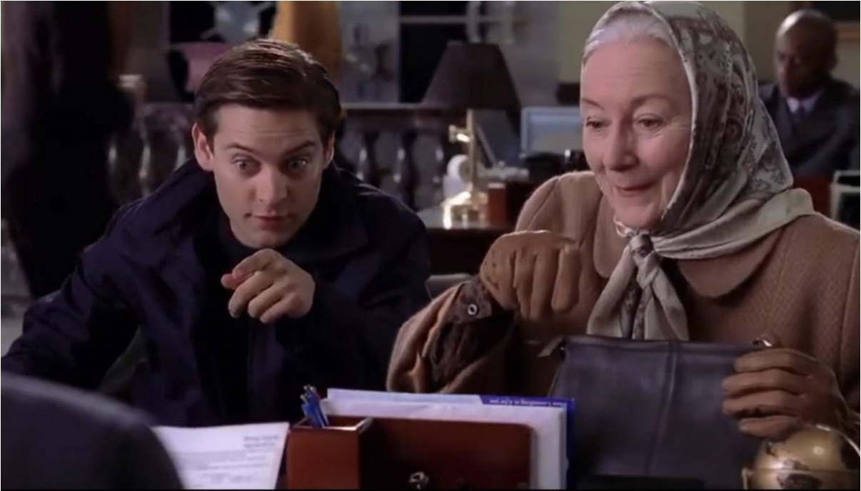
Pyè Parker Ak Matant Me