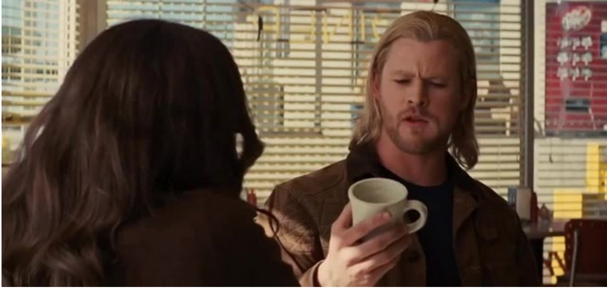
Thor Diner Sèn