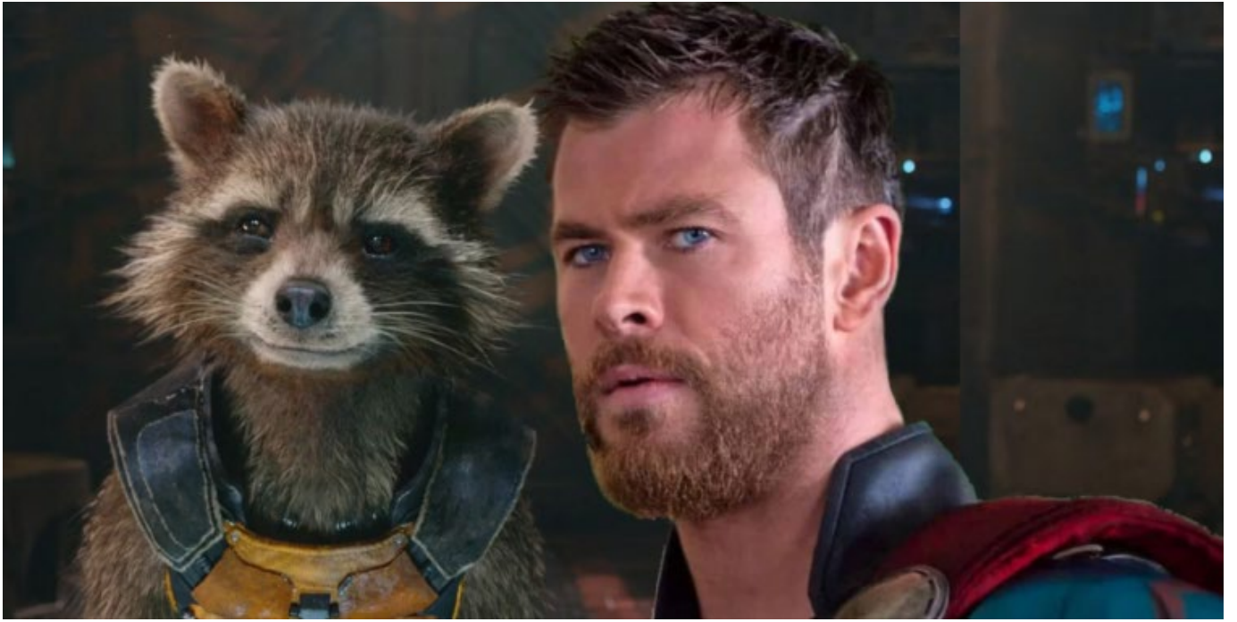
Wòkèt Raccoon Ak Thor